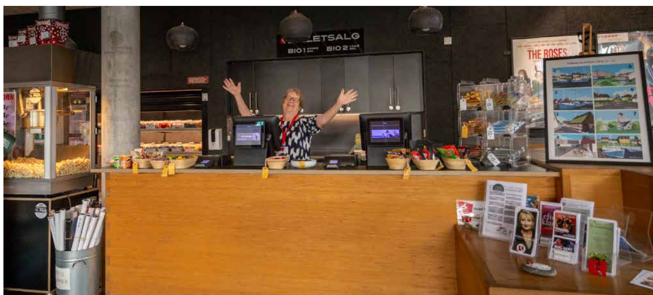
Velkommen i biografen

Selvom der er forskellige grunde, er der nogle fællestræk i engagementet og også i den hyldest fra lokalbefolkningen, der bliver huset til del.