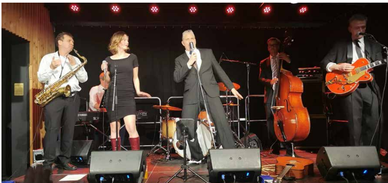
The Scoops spiller i Kulturhavnen