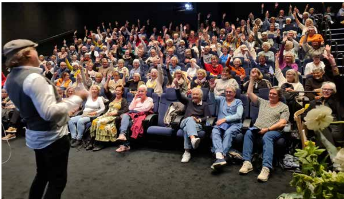
Bio1 i brug som foredragssal.

Biografsalene bruges desuden til events, møder og foredrag.